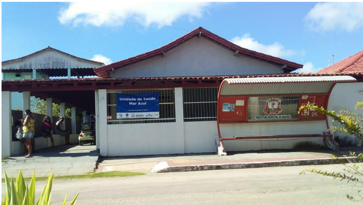
Legenda: Unidade de Saúde de Mar Azul, local alugado.