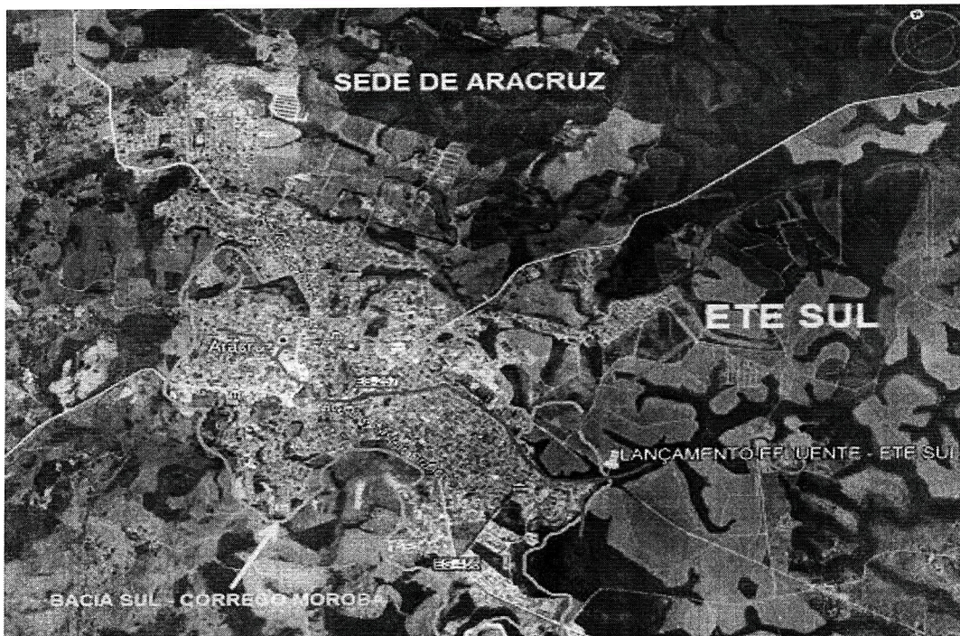
Figura 01 – Identificação da bacia, coletor 9 e ETE Sul.